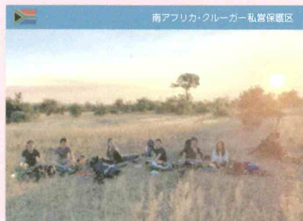
南アフリカ・クルーガー私営保護区