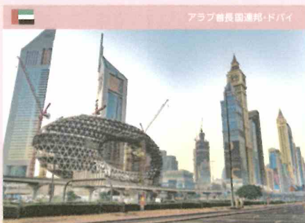
アラブ酋長国連邦・ドバイ