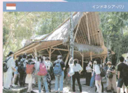
インドネシア・バリ