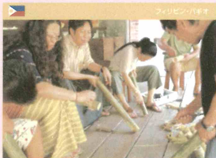
フィリピン・バギオ

ハーバードデザインスクール博士生監修デザインプロジェクトを通して、途上国支援を考える