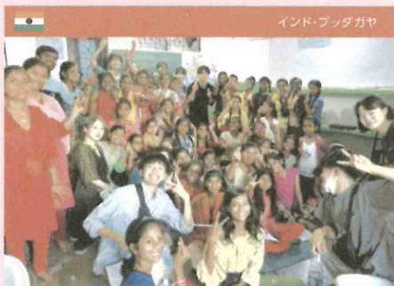
インド・ブダガヤ