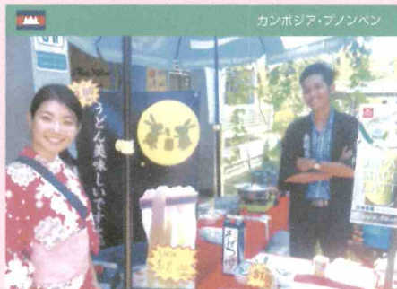
カンボジア・フノンペン

あなたが伝えたい日本の魅力はなんですか？アジアで、日本をバズらせる親善大使になれ！